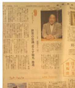
a real estate agent