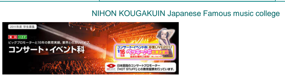
NIHON KOUGAKUIN Japanese Famous music college